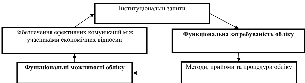
Рис. 1. Стадії реалізації функцій бухгалтерського обліку